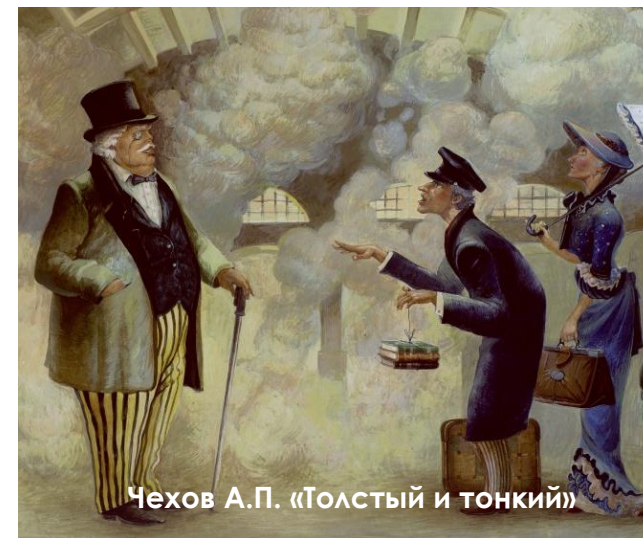
Чехов А.П. «Толстый и тонкий»

Межпоселенческая центральная библиотека им. А.Н. Апухтина