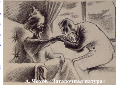
А. Чехов «Загадочная натура»

Меня потряс рассказ «Загадочная натура», где пошлая и глупая женщина, считающая себя «страдалицей во вкусе Достоевского», рассказывает молодому писателю, пишущему «новэллы», о своей несчастливой жизни, о напрасных поисках счастья, о жизненных препятствиях в лице «богатых стариков», за которых она, несчастная мученица, вынуждена выходить замуж... Какая злая насмешка, едкая ирония чувствуется во всем этом! И как больно за Россию, развращенную такими людьми!