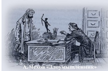
А. Чехов «Злоумышленник»

жителей маленького города, погрязших в пошлости, подхалимаж полицейских. В своих рассказах Антон Павлович также затронул народную тему. Он бывал в русских деревнях, где его поразила темнота и необразованность русского народа. Это нашло отражение в таких его рассказах, как «Налим», «Злоумышленник». Во многих своих рассказах Чехов высмеивает мещанство, обывательщину. Таковы рассказы «Папаша», «Письмо к ученому соседу», «Загадочная натура», «Из дневника помощника бухгалтера». Чехов ненавидел пошлость, мещанство, консерватизм, в ко-