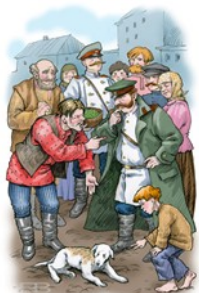
А. Чехов «Хамелеон»

Антон Павлович Чехов поднял смех на новую высоту, и в этом заключается его вклад в русскую и мировую литературу. Смех Чехова поразителен — веселый, сверкающий и вместе с тем направленный не на случайное и побочное, а всегда умеющий открыть какую-нибудь важную, типическую сторону общественных отношений. Чехов сделал смех орудием борьбы с пошлостью и мещанством, и в этом заключается его заслуга, его гений.