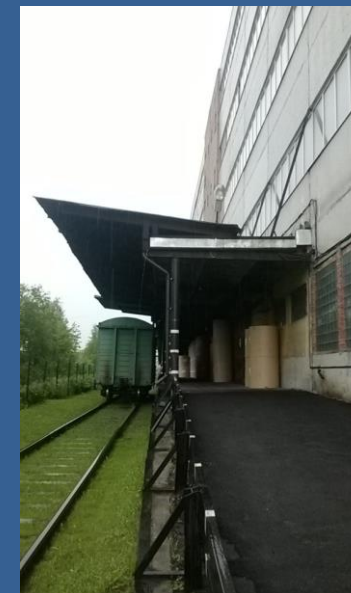
Складской комплекс "Парнас", СПб