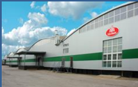
Складской комплекс "Шувалово", СПб