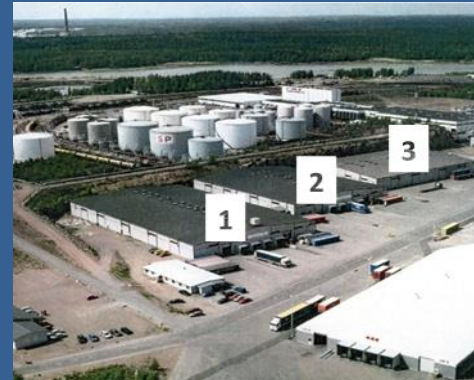
Таможенный склад в порту Хамина/Котка