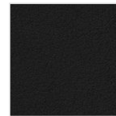
65| 661 Naturale