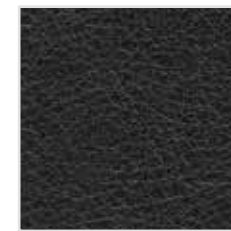
60| 610 Palermo