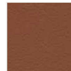
60| 642 Palermo