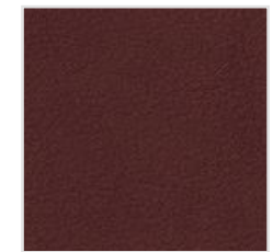
65| 664 Naturale