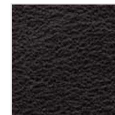
60| 641 Palermo