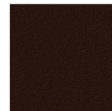
65| 662 Naturale