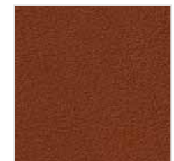
65| 663 Naturale