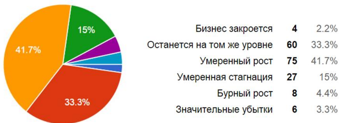
Рис. 1 – Перспективы развития бизнеса на 2015 год в Ростове-на-Дону

67,2% опрошенных отметило, что изменений как таковых не наблюдается - не увидели серьезных изменений, способных повлиять на деятельность предприятий малого бизнеса. И это не удивительно, учитывая, каким непростым выдался прошлый год и начало 2015. 23,9% респондентов ещё более пессимистичны, они утверждают, что работать в городе стало сложнее. Это утверждение требует дополнительной проверки и подвергнется анализу в интервью. 6,1% отмечают улучшения проводимой государством поддержки малого бизнеса в г Ростове-на-Дону.