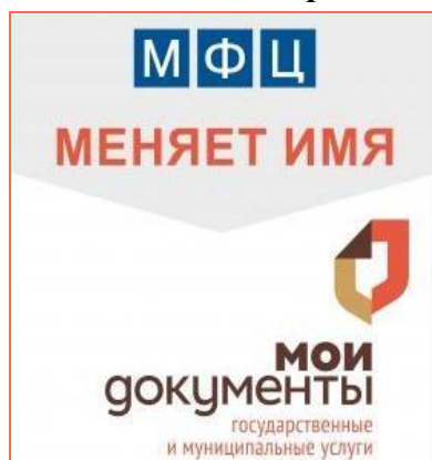
Рис. 2 - Ребрендинг

Подробности о деятельности МФЦ на электронных ресурсах: