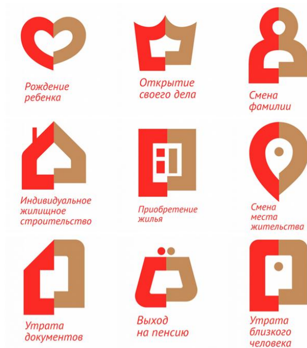
Рис. 1 – Жизненные ситуации

Из 129 предоставляемых услуг 56 услуг ориентированы, в том числе, на бизнес. С декабря 2015 г. количество услуг для бизнеса увеличится еще на 76 – в основном, это получение госсубсидий