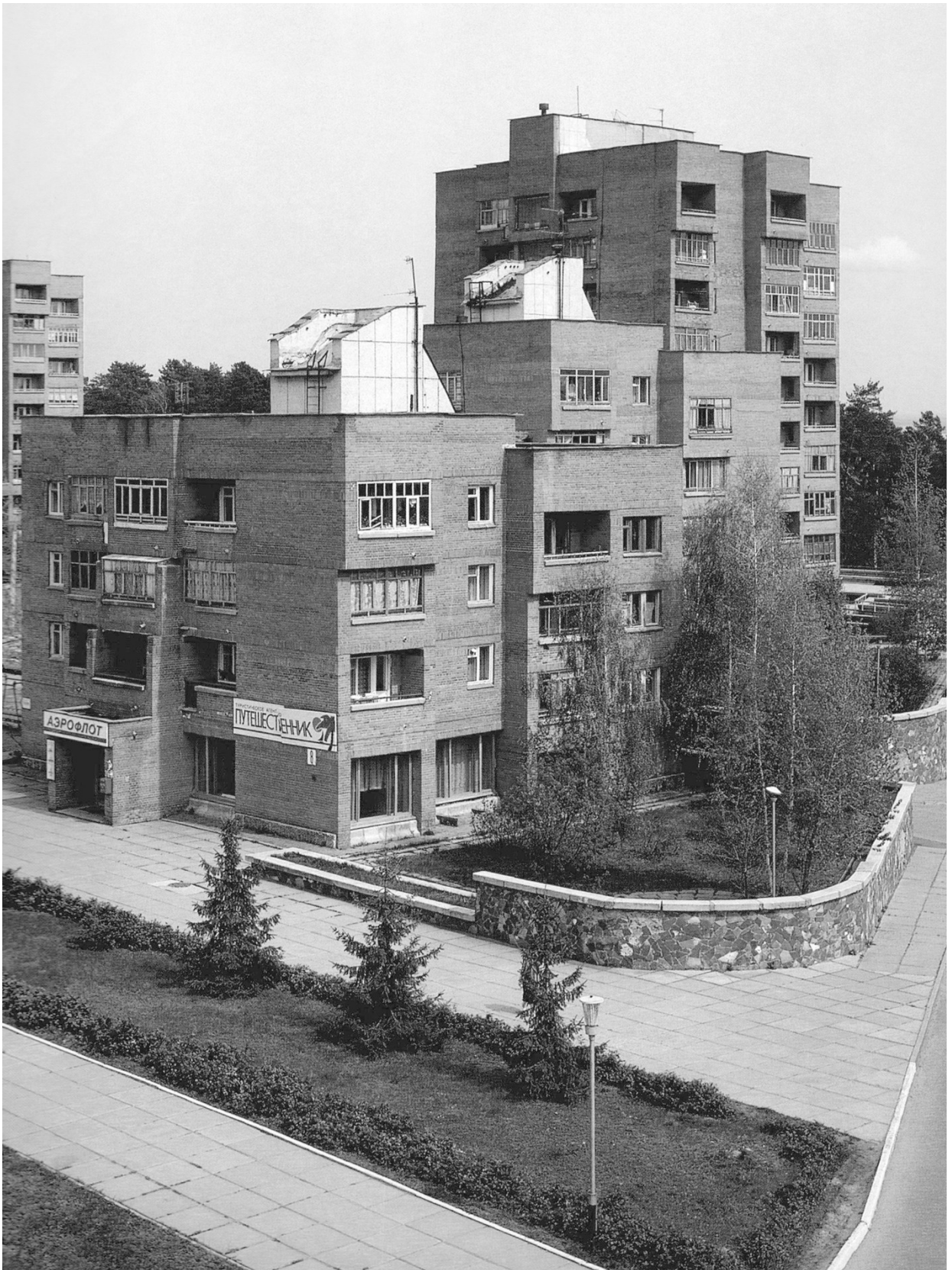
Жилые дома на проспекте им. Г.Димитрова