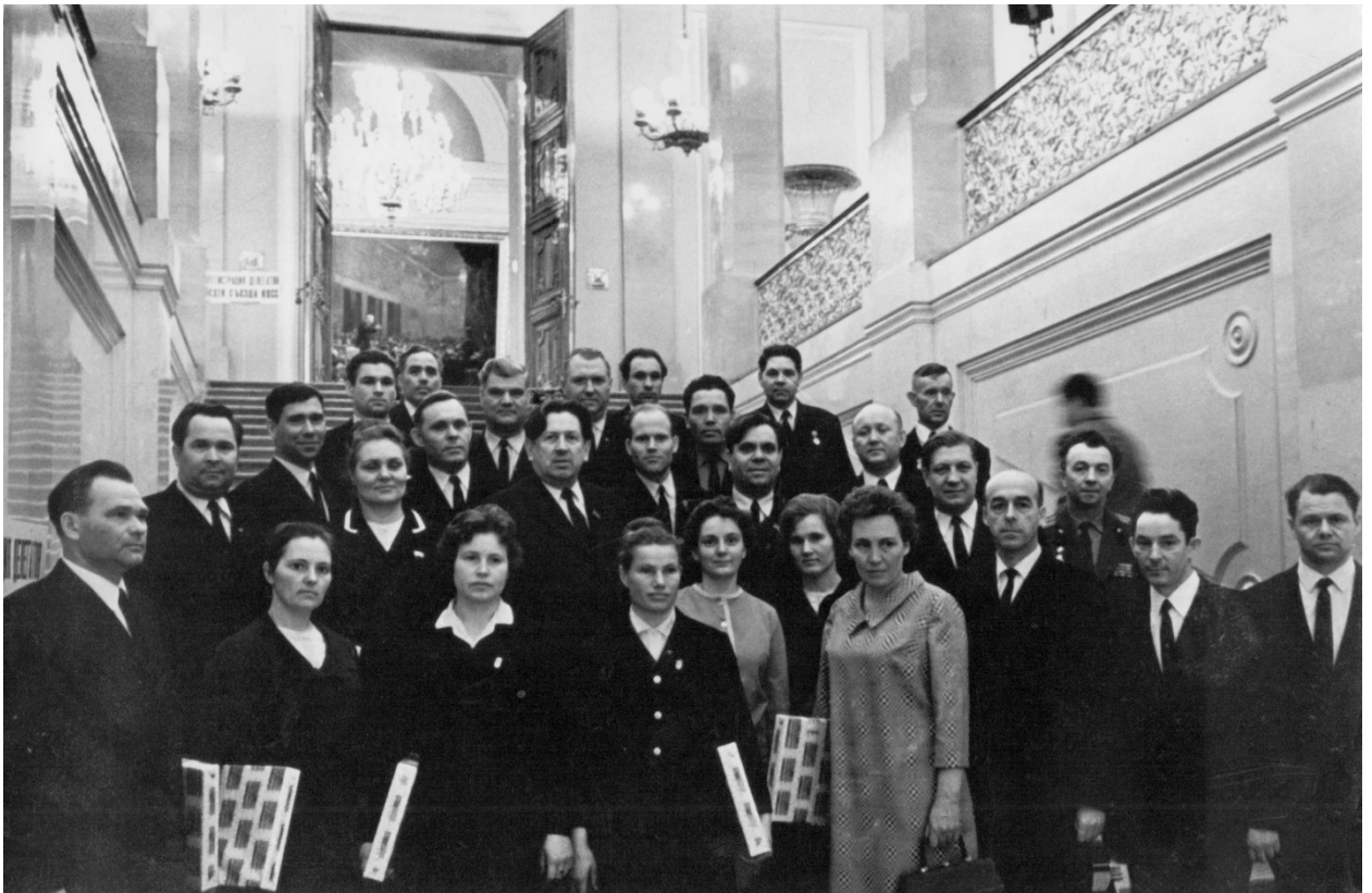
Делегация Ульяновской области на 24 съезде КПСС