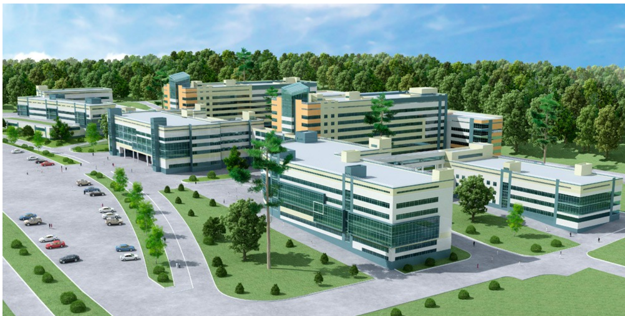
Будущий радиологический центр

В соцгороде, в лесной зоне возводится радиологический медицинский центр международного значения. Рядом с центром строится новый жилой микрорайон «Академгородок» для его сотрудников.