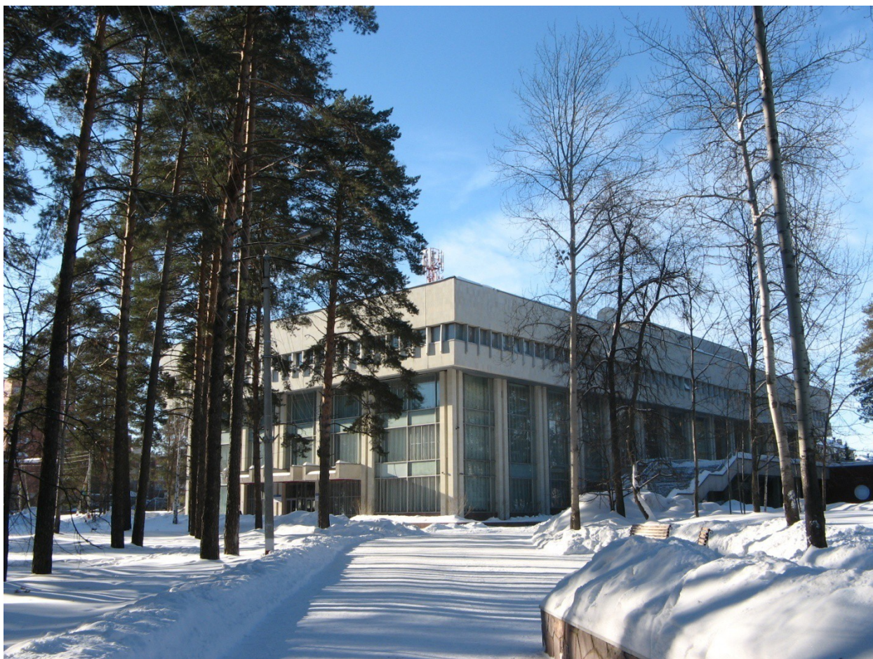
Научно – культурный центр им. Славского Е.П.