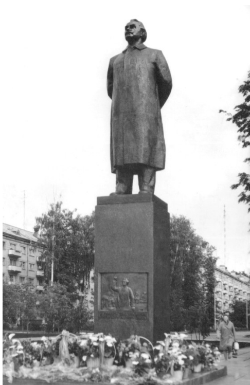
Памятник Георгию Димитрову

12 июня 1982 года при стечении многих горожан памятник был открыт. На мероприятиях присутствовал чрезвычайный посол Болгарии в СССР Димитр Жулев. Он не без обиды заметил, что у русских фигура Димитрова намного выше и солиднее. Посол сказал, поделился Полнов Г.Ф., что их правительство выделяет болгарскому Димитровграду намного меньше средств, чем у нас их городу – побратиму.