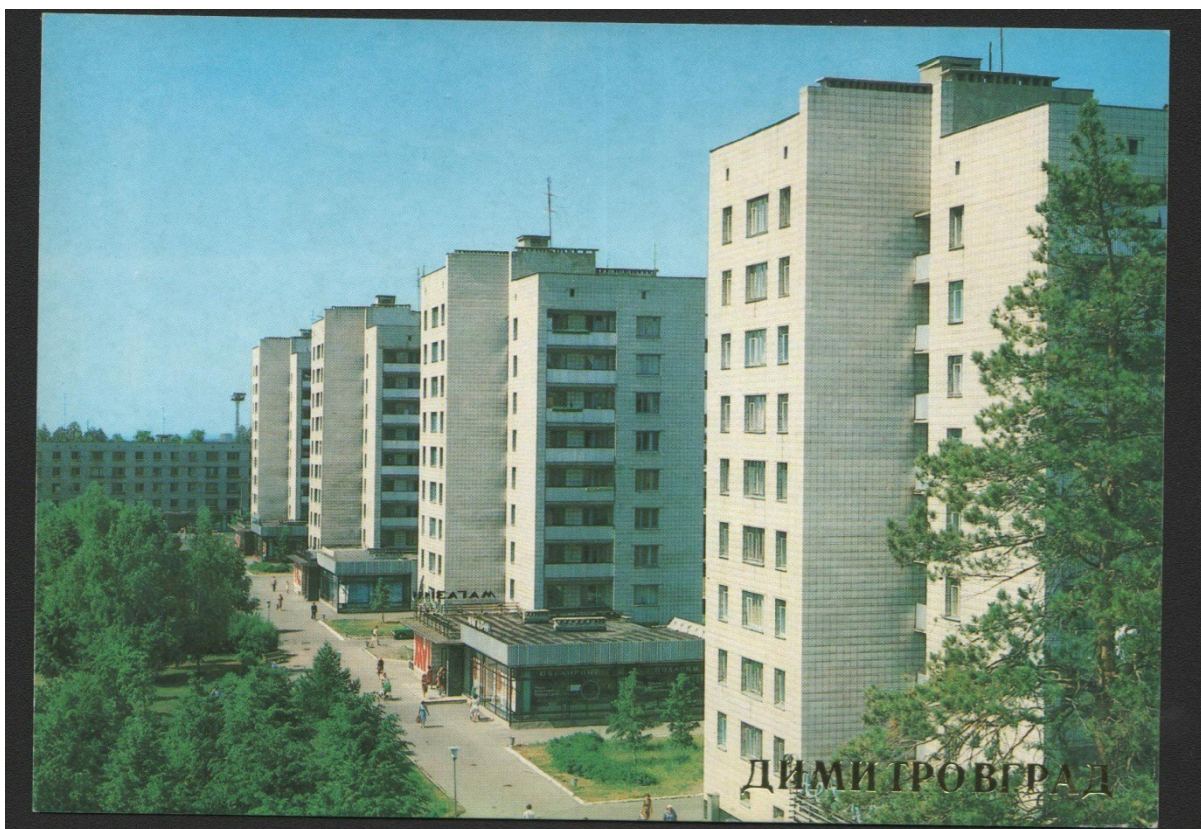
Проспект им. Ленина.