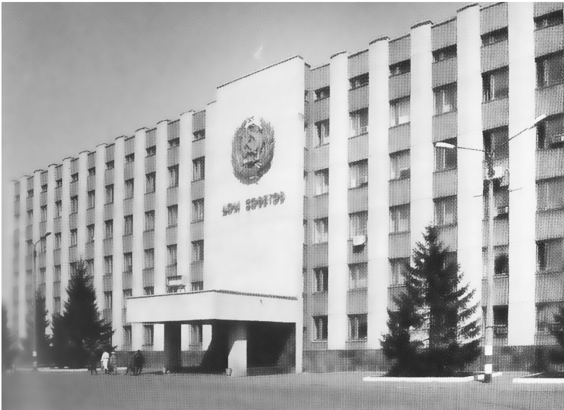
Здание городского Совета народных депутатов города Димитровграда (ныне – здание Администрации города)