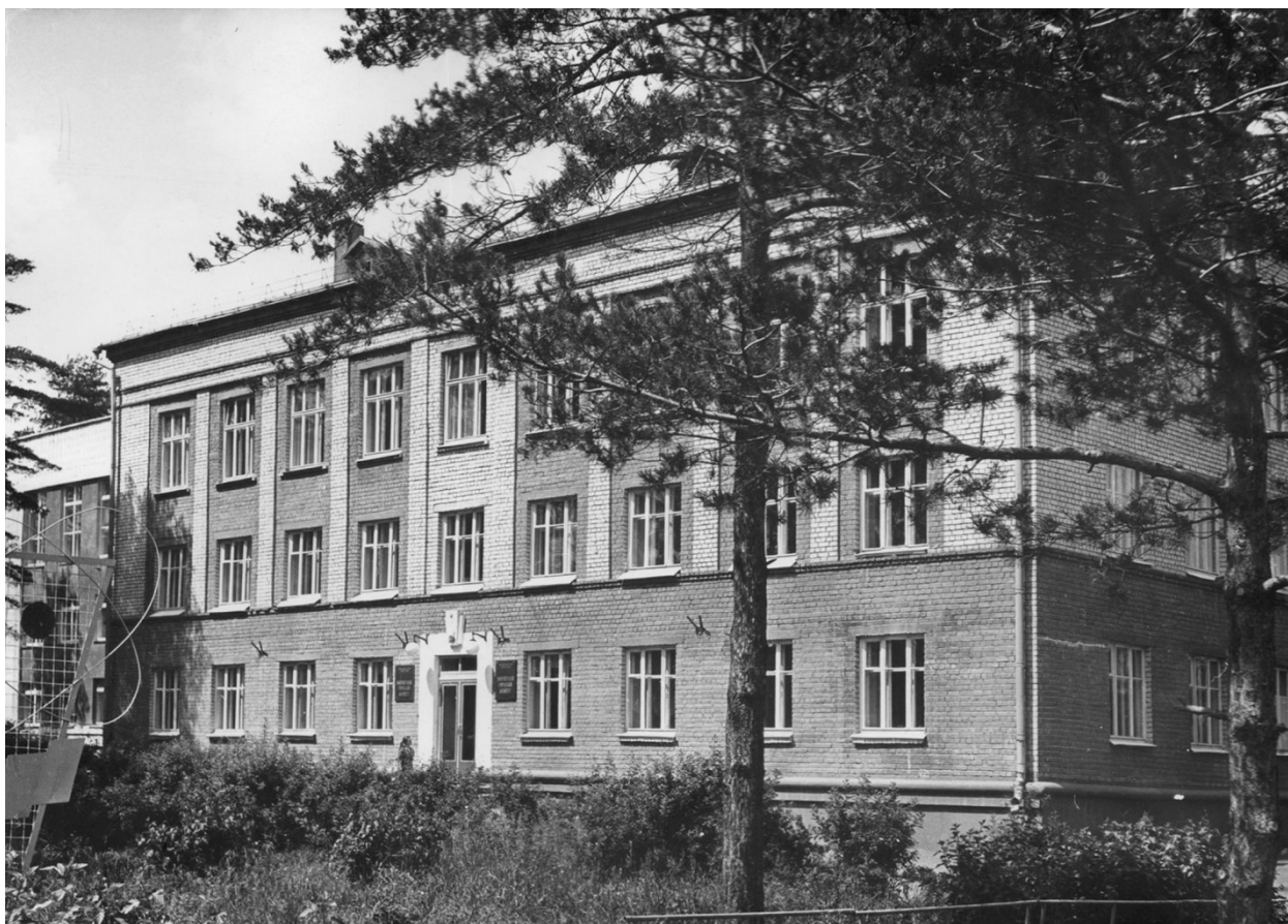
Здание городского комитета партии (ныне – музыкальное училище)