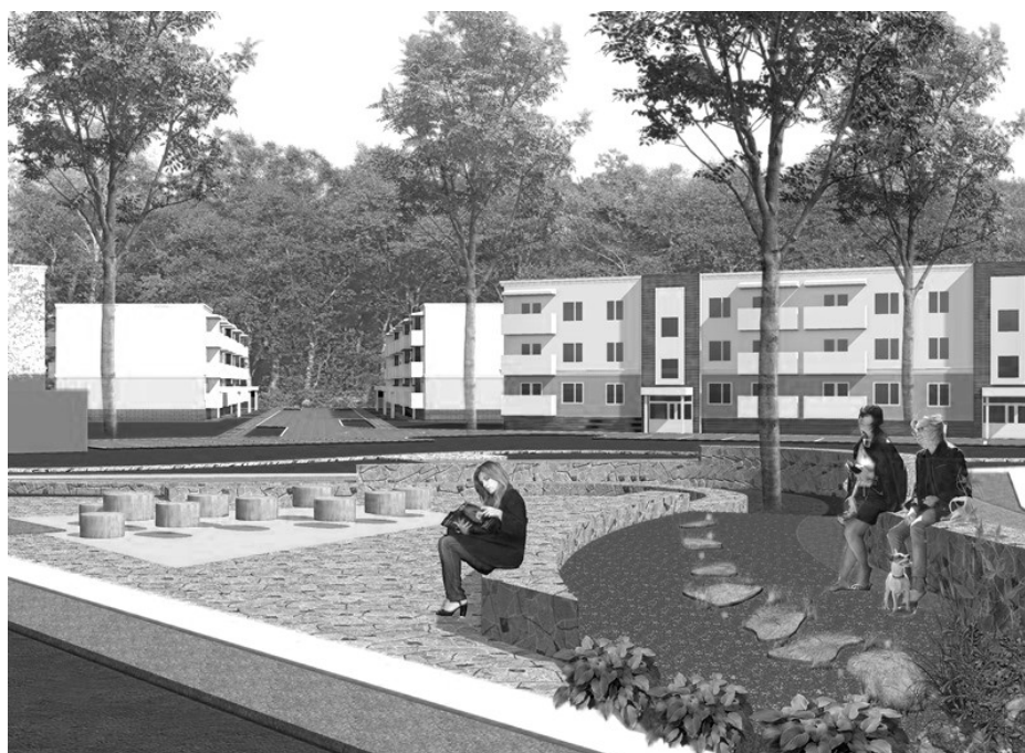
Вот так будет выглядеть наш «Академгородок»