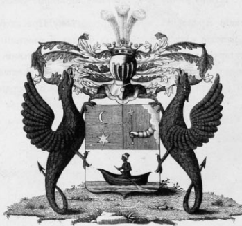
ГЕРБЪ РОДА АРАПОВЫХЪ.