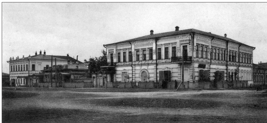
Мелекесс. Дом посадского головы