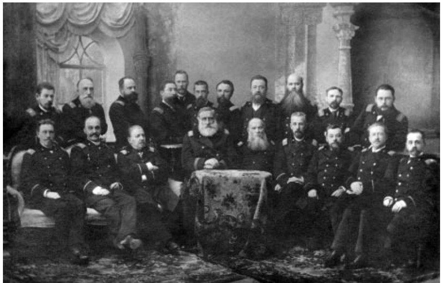
Члены Самарского окружного суда. 1895

На третий день в помещении посадской думы приглашены были гласные и