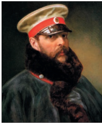
Император Александр II